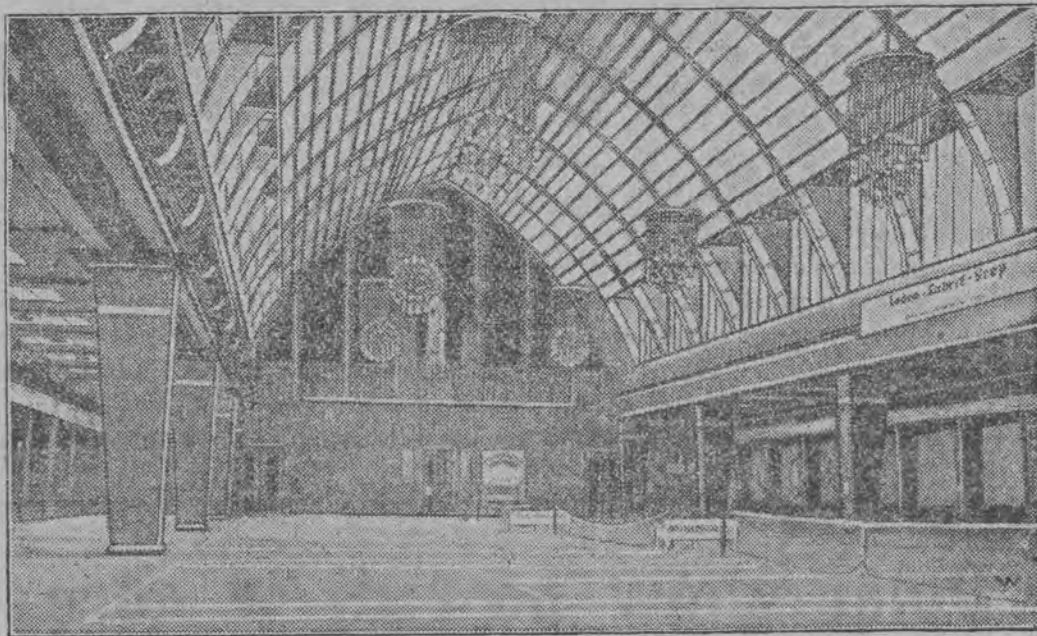
Wykończona w ubiegłym tygodniu hala tenisowa w Monachium, której powierzchnia court'ów liczy 3.600 mtr. kwadr.