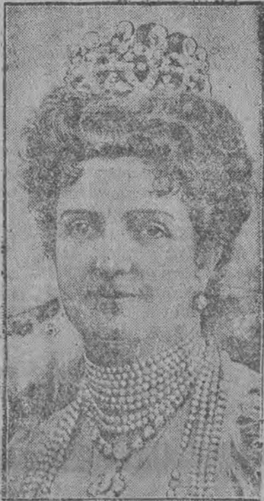
Królowa Małgorzata, żona zabitego króla Humberta zmarła w tych dniach.

Matka królewska pozostawiła po sobie szczerzy żal narodu włoskiego, który jest nader przywiązany do dynastji sabaudzkiej, demokraci widzą w niej jedyną ostoję demokratycznego ładu i porządku parlamentarnego, zagrożonego przez faszystów i ich wodza Mussoliniego. Tembardziej, że z imieniem zmarłej łączą się nierozzerwalnie wspomnienia patriotyczne i wolnościowe wspomnienia antyhabsburskiej epopei.