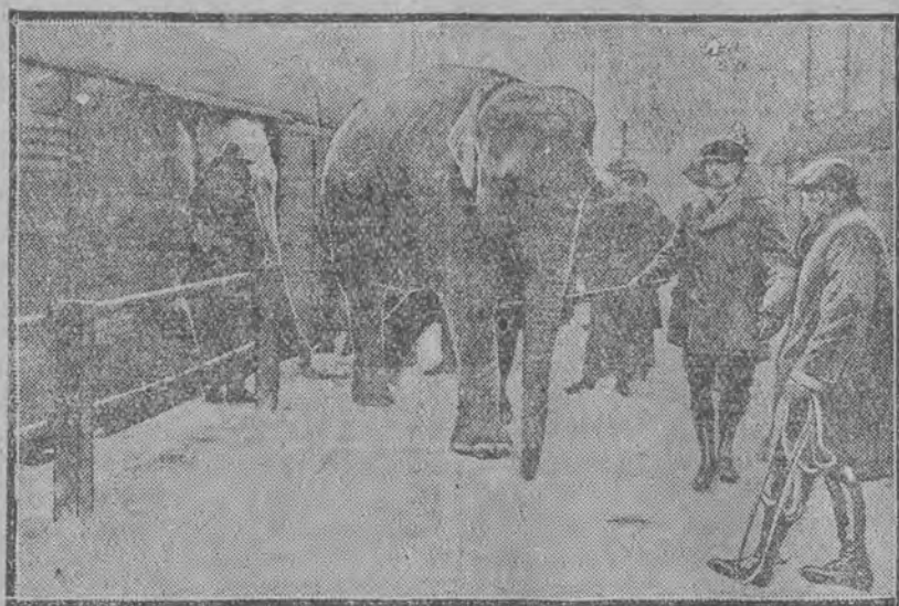
Słoń „Jonny” z cyrku Buscha przybył na występy do Drezna