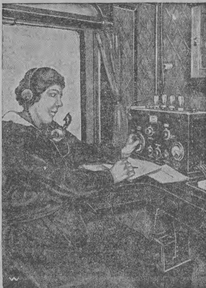
Telefonistka na stacji telefonicznej w pociągu daje połączenie pasażerowi

W ten sposób nastąpiły złe czasy dla zbrodniarzy. Dotychczas, jak długo siedzieli w pociągu, mogli drzeć tylko przed sobą. Dzisiaj jednakowoż każdy zbrodniarz będzie się czuł też niepewnie i w pociągu, a nawet do pewnego stopnia będzie w gorszym położeniu, gdyż z jadącego pociągu ucieczka nie jest łatwa.