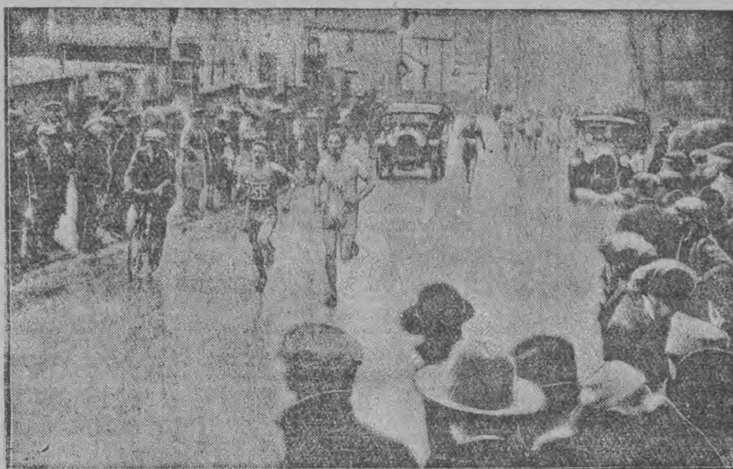
Bieg uliczny o nagrodę Lenouiera w Paryżu