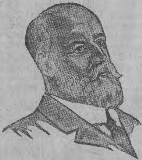
Don Emiliano Figueroa Nowy prezydent republiki chilijskiej

Ogłoszenia za wiersz milimetry i szpaltowy 40 strona i w teńście 40 groszy strona 4 szpalt Nekrologi 30 „ „ „ „ Nadesłane po teńście 30 „ „ „ „ Zwyczajne 10 „ „ „ „ strona 10 szpalt Ogłoszenia zaręczynowe i zaślubinowe 10 zł. 0000 Ogłoszenia zamiejscowe obliczane są o 50 procent 2% zaś firm zagranicznych o 100 procent drożej