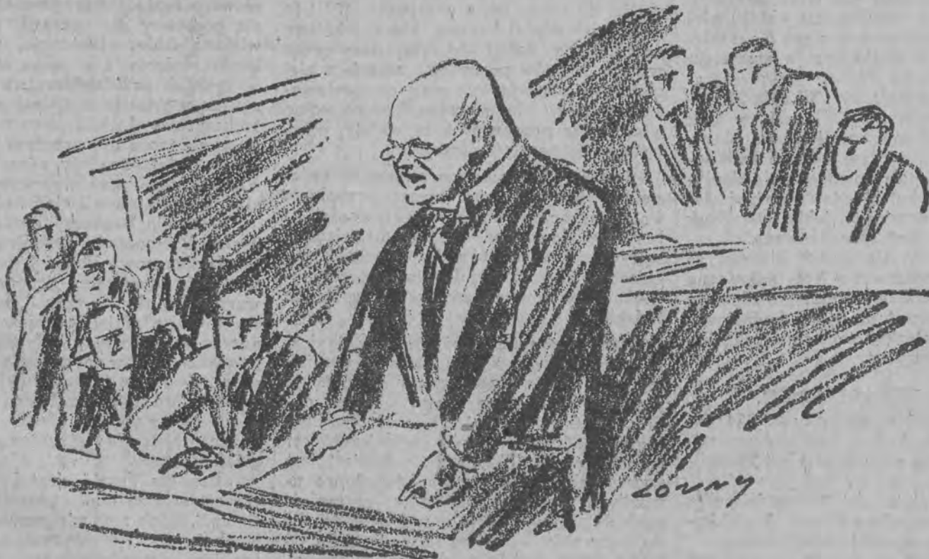
Kanclerz Luther w imieniu nowego gabinetu wygłasza w Reichstagu exposé rządowe

O starciach na tem tle wynikłych, donoszą także z Wrocławia i kilku innych miast prowincjonalnych.