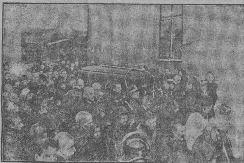
Przeniesienie trumny z rampy kolejowej na karawan