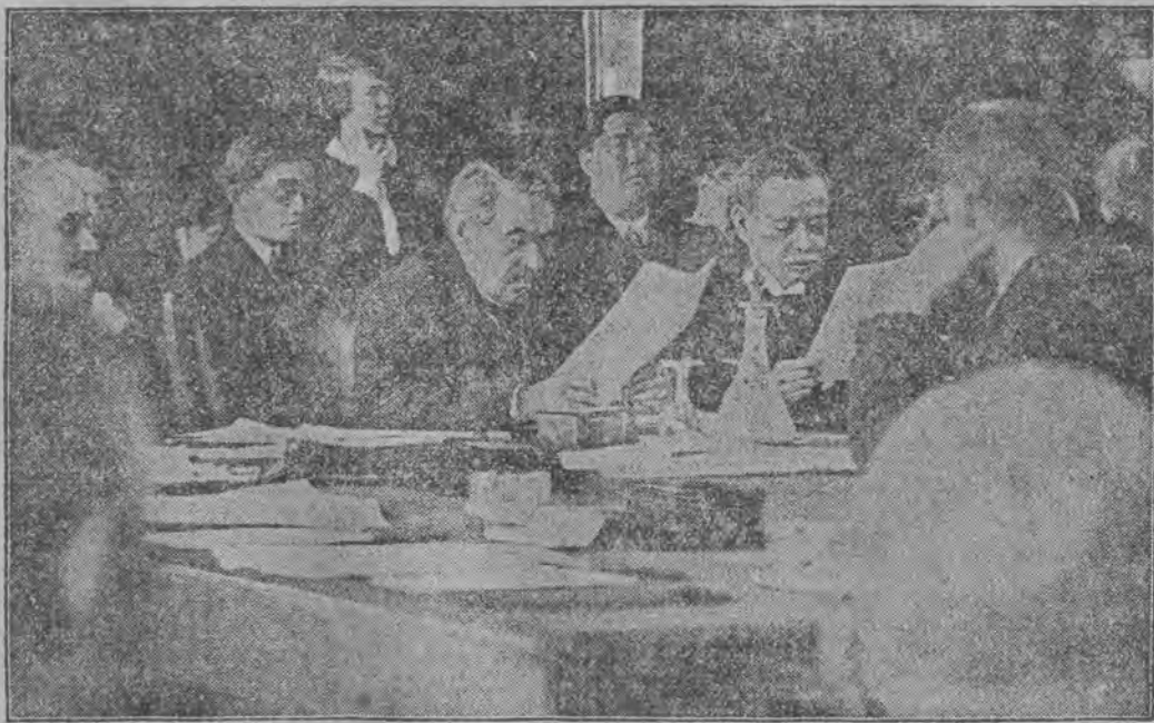
Konferencja Brianda z delegatem Japonii hr. Ishii.