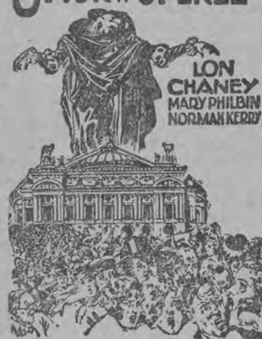
LON CHANEY MARY PHILBIN NORMAN KERRY

Według rozgłośnej powieści Gastona Leroux p. t. „Le Fantôme de L'Opéra“