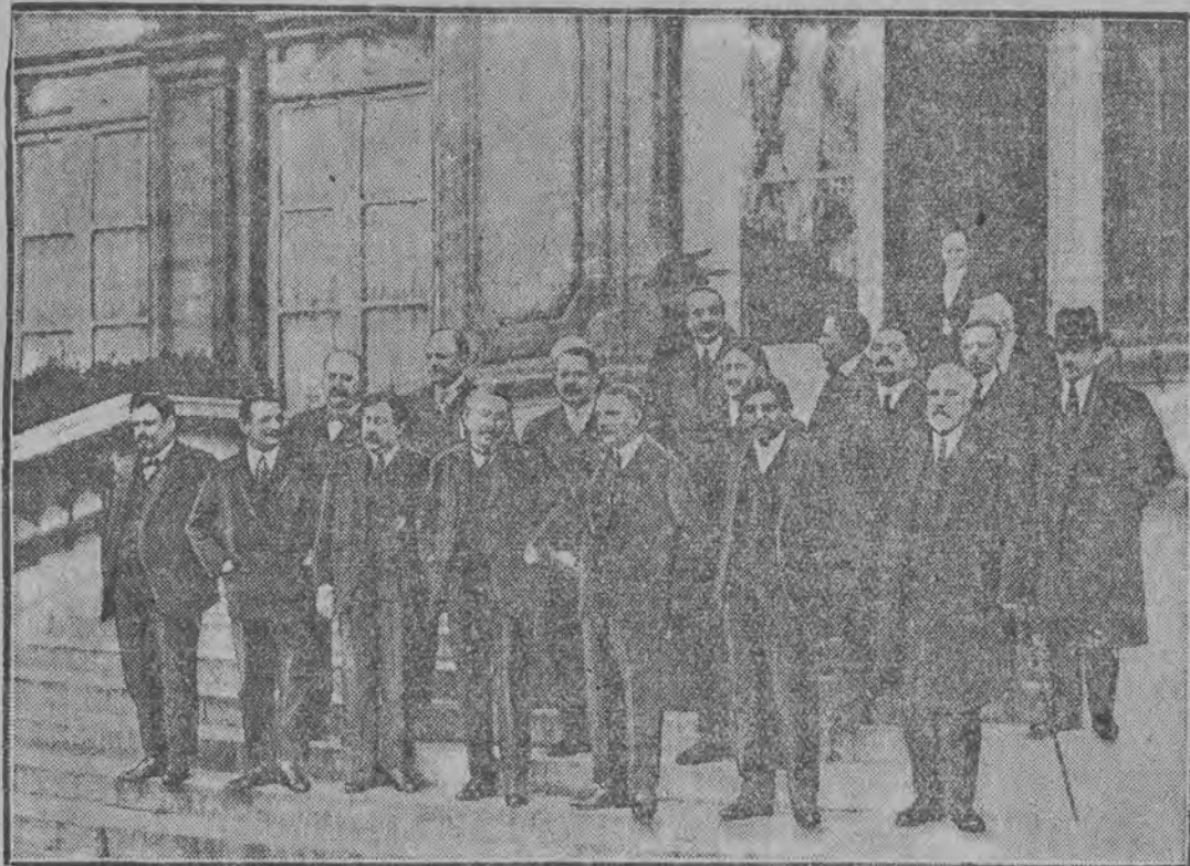
Czwartą postacią w pierwszym rządzie jest prezes ministrów Briand; obok premiera stoi z lewej strony minister wojny Painleve, z prawej min. finansów Raoul Peret