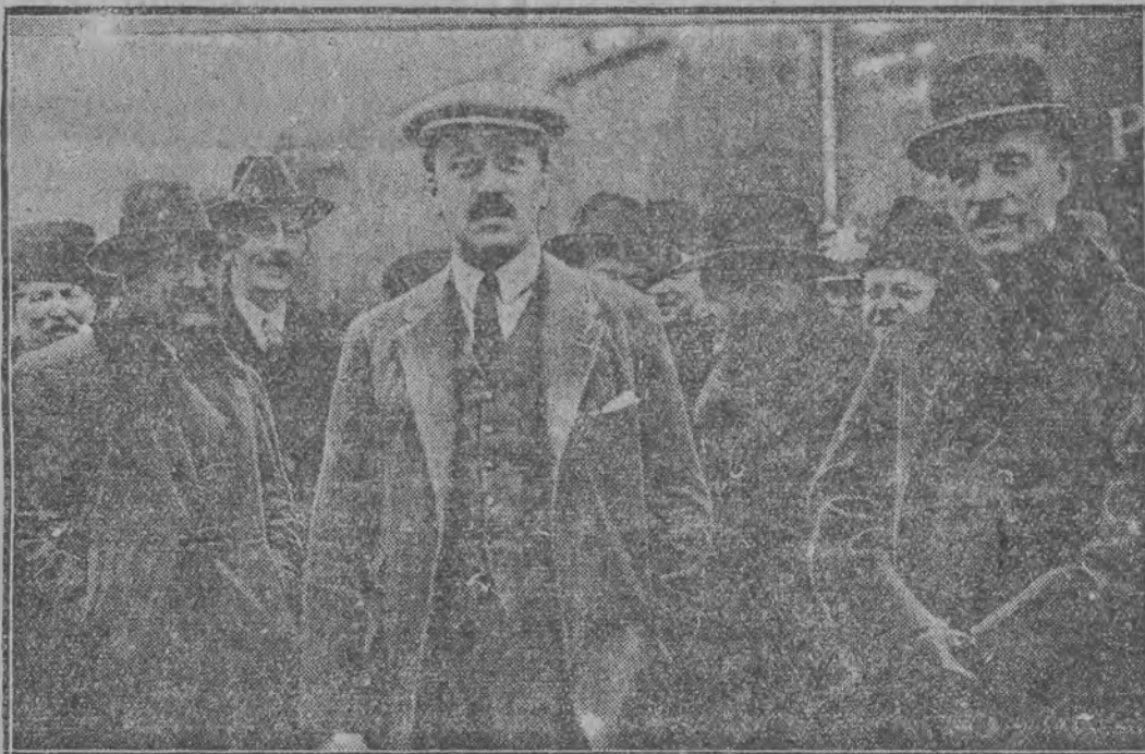
Premier Skrzyński w otoczeniu rządu na dworcu kolejowym w Warszawie po wyjściu z pociągu