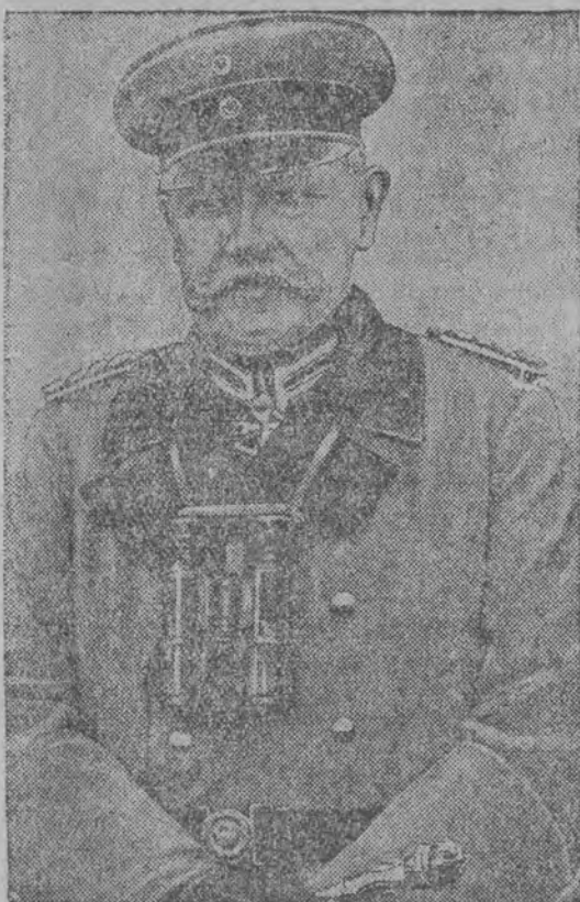
Marszałek Hindenburg obecnie głowa państwa niemieckiego, obchodzi 60-letni jubileusz swego wstąpienia do armji

¶ Ogłoszenia za wiersz milimetrowy i szpaltowy i strona i w tekście 40 groszy, strona 4 szpalt Nekrologi 30 " " " " Nadesłane po tekście 30 " " " " Zwyczajne 10 " " strona 10 szpalt ¶ Ogłoszenia zaręczynowe i zaślubinowe 10 zł. 00 00 ¶ Ogłoszenia zamiejscowe obliczane są o 50 procent ¶ zaś firm zagranicznych o 100 procent drożej ¶