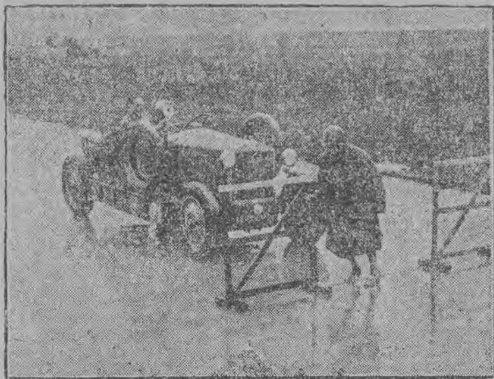
Maszyna, która zdobyła championat na zawodach samochodowych artystów francuskich

w których biorą udział aktorzy, za widowiska i to widowiska w minimalnej tylko mierze sportowe. Nawet aktorzy, których specjalnością są role tragiczne, przedzierzga się nieuchronnie w komików,