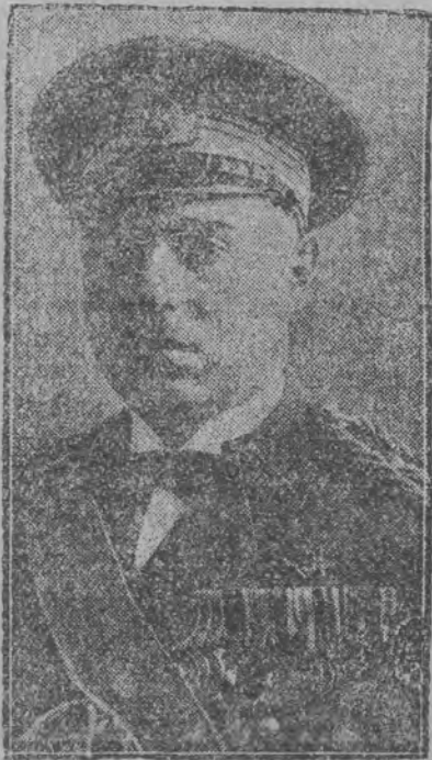
Komandor Ludwik de Pinedo.

Markiz de Pinedo, komandor włoskiej marynarki, który w roku ubiegłym odbył przelot nad trzema kontynentami: Europą, Azją i Australją, ogólnej długości 55000 km., organizuje obecnie, jak już donosiliśmy, nowy raid o jeszcze większym zakresie. W połowie lipca wyruszy on z Marina di Pisa do Afryki zachodniej, przeleci przez Atlantyk do Ameryki Południowej. Przebywszy kontynent amerykański aż do Alaski, uda się ponad cieśninę Behringa do Syberji. Stąd przez Japonię, Polinezję i Mikronezję przyleci do Australji i via Indje, Arabję i Egęę powróci do Włoch.