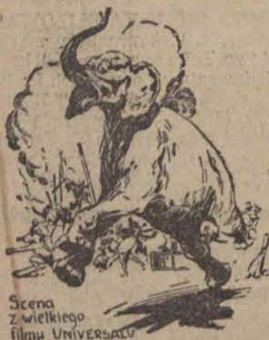
Scena z wielkiego filmu UNIVERSALU „SAMSON CYRKU”

Orkiestra symfoniczna pod kierunkiem S. BAJGELMANA.