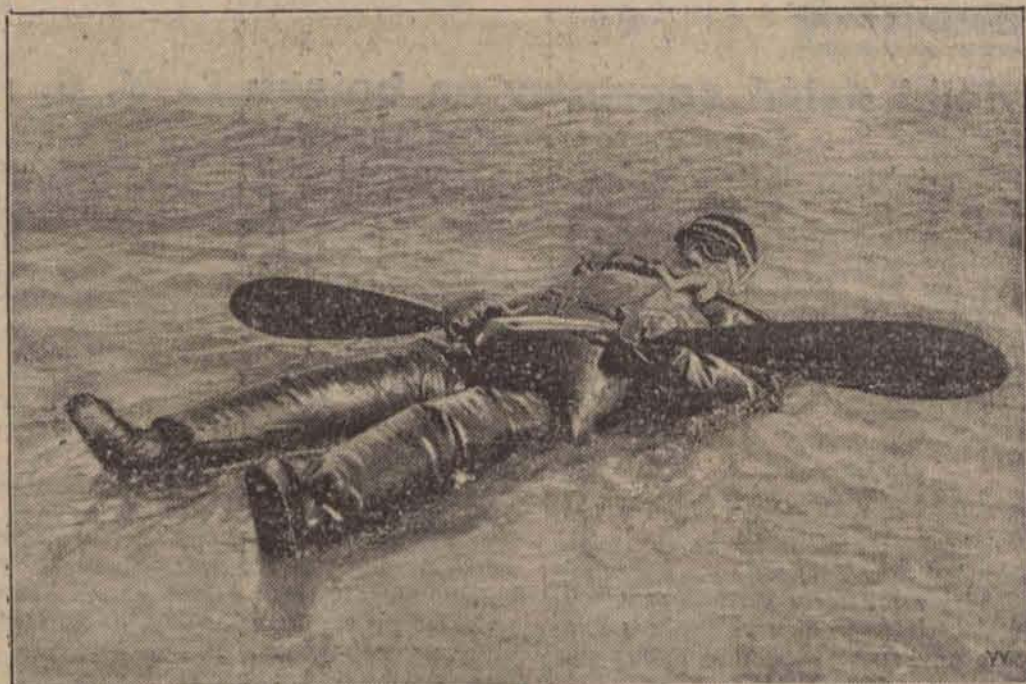
Amerykański wynalazca skonstruował specjalny ubiór gumowy, który pozwala rozbitkowi w wygodnej pozycji leżącej przepływać znaczne przestrzenie w wodzie przy pomocy małych wiosłek.