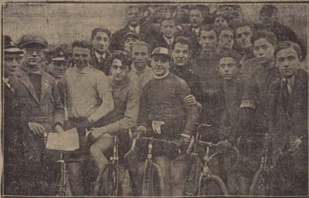
W dniu wczorajszym odbyły się na torze helenowskim zawody kolarskie o mistrzostwo szkół średnich naszego miasta, w których brali udział uczniowie siedmiu szkół średnich. - Zdjęcie przedstawia grupę startujących.

Warszawa, 27/X. W mieszkaniu ministra Kwiatkowskiego w gmachu Prezydium Rady Ministrów niewykryci złodzieje ukradli ministrowi dwa nowe palta i sweter.