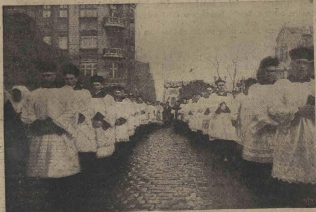
Wczorajsze uroczyste przeniesienie relikwii św. Stanisława Kostki z kościoła św. Krzyża do Katedry.

Przyczyną niżki cen węgla jest zmniejszenie się eksportu węgla zagranicę i zbliżająca się wiosna.