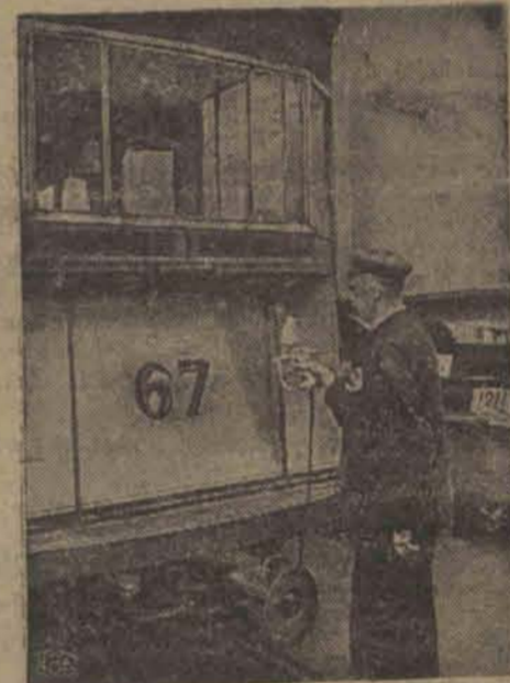
W celu szybszego odnawiania starzych wagonów, dyrekcja tramwajów miejskich zakupiła nowy aparat do lakierowania, który jest pierwszym tego rodzaju przyrządem w Polsce. Na ilustracji widzimy lakiernika stosującego nowy aparat przy pracy.

To wywołało ferment wśród robotników i wczoraj po skończeniu pracy przez dzienną zmianę zaatakowali biura dyrekcji fabryki, gdzie wybito wszystkie szyby. Robotnicy usiłowali dostać się do magazynów z amunicją. Wówczas dopiero wezwano policję, która robotnicy przyjęli wrogimi okrzykami oraz kamieniami. Policjanci zaczęli rozpedzać tłum usuwając wszystkich z terenów fabrycznych. W tym czasie dyrekcja fabryki ogłosiła, że w dniu dzisiejszym wszystkie zaległości będą wypłacone. Tłum się uspokoił. Nocna zmiana przystąpiła natychmiast do pracy. Mimo to fabryka jest pilnie strzeżona przez silne oddziały policji.