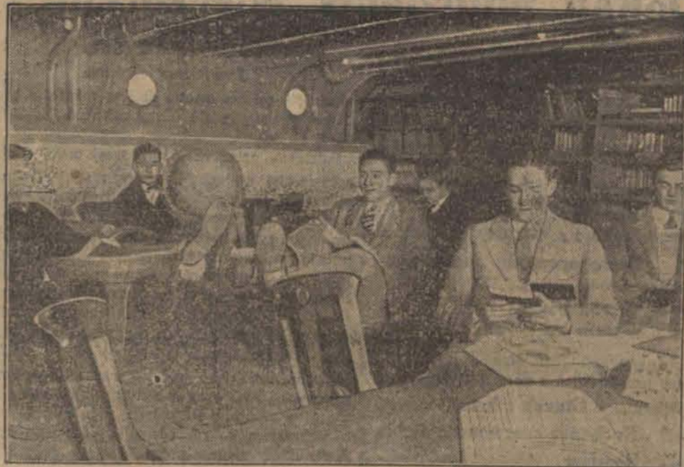
I) Przybycie pływającego uniwersytetu amerykańskiego do portu w Hamburgu. Jak wiadomo na okręcie tym przebywa stale zgórą 500 studentów i studentek amerykańskich, w towarzystwie odpowiedniej liczby profesorów uniwersytetu, którzy podczas przejazdów po oceanach wykładają w dziedzinie swych specjalności. — II) Studenci w jednej z bibliotek okrętowych.