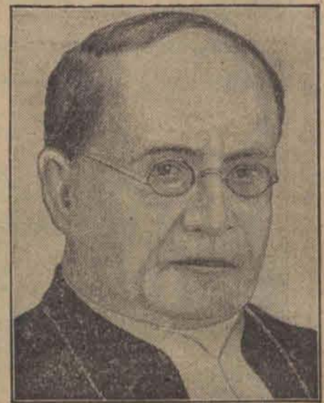
Papież Pius XI skończył jak wiadomo, dnia 31 marca b. r. 70 lat życia. Powyższa fotografia jest najnowszym zdjęciem następcy św. Piotra.