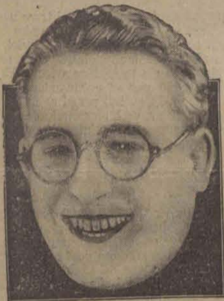
Znany amerykański, komik filmowy Harold Lloyd przystąpi latem do realizowania nowego filmu, który będzie odegrany w Europie. Lloyd przybył już w tym celu do Europy i odwiedził Berlin i Paryż.