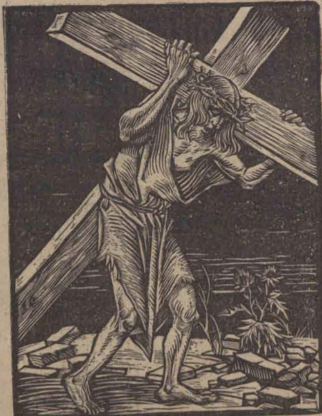
R. Schiestl: Droga na gólgotę.