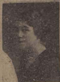
P. Otylja Łuba, ul. 28 p. Strz. Kan. 40.