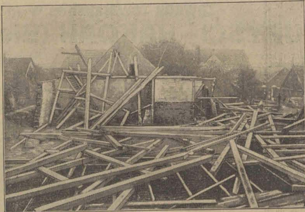
Straszliwy orkan, który nawiedził pogranicze niemiecko-holenderskie, wyrządził olbrzymie szkody i spowodował szereg śmiertelnych wypadków z ludźmi. O niebywałej sile wicheru świadczy powyższa ilustracja, przedstawiająca wieś Streitziąg pod Nowym Szczecinem.