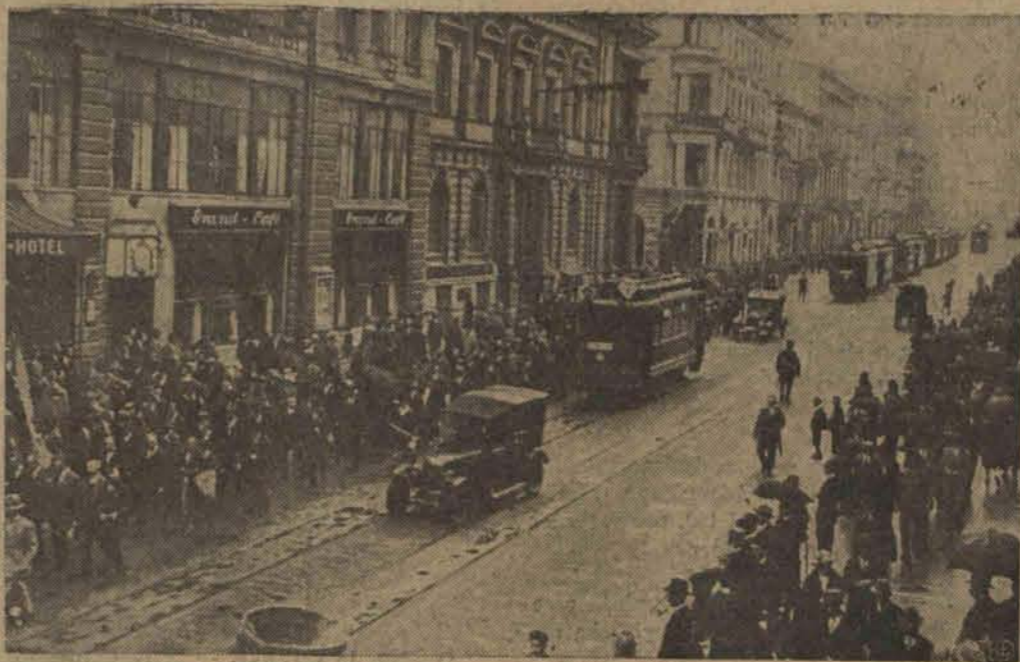
Koniec pochodu organizacji spółdzielczych na ulicy Piotrkowskiej.