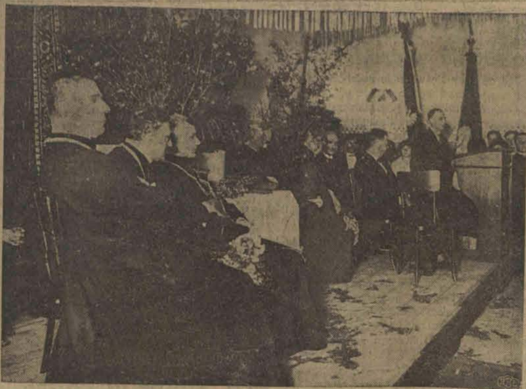
Uroczysta akademja w obecności ks. ks. Biskupów i przedstawicieli społeczeństwa.