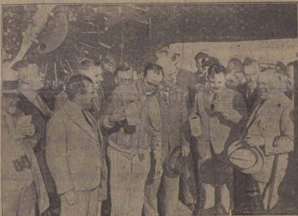
Lotnikom transatlantycznym, przybyłym z Ameryki, kraju przymusowej abstynencji, podano po przybyciu do Monachium słynne monachijskie piwo.

dy na Wiśle trwa w dalszym ciągu. Kulminacyjny punkt oczekiwany jest w niedzielę. W związku z tem wydano zarządzenie, aby wzmocnić wały ochronne pod Warszawą.