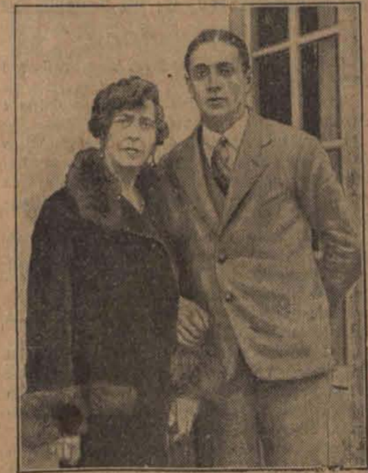
W STARYM PIECU..

61-letnia księżniczka Wiktorja, siostra eks-króla, Wilhelma, ze swoim narzeczonym 23-letnim tancerzem kabareto-wym Zubowym.