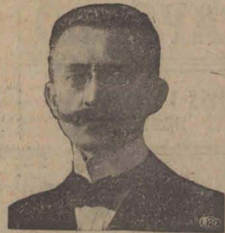
P. BOLESŁAW KNAPSKI naczelnik wydziału budżetowego udekorowany został krzyżem oficerskim orderu „Polonia Restituta“.