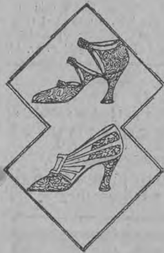
Oryginalną ozdobą pantofli są klamry, jak to widać na naszym wzorze