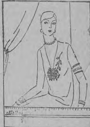
Sztuczne kwiaty są coraz modniejsze. Specjalnym powodzeniem cieszą się sztuczne róże, orchideje chryzantemy i goździki.