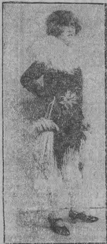
Suknia wieczorowa, przybrana strusimi piórami.

Według wieści nadchodzących z wielkich laboratoriów mody w Paryżu, zima najbliższa przywróci do dawnego stanowiska strusie pióra. Nie wrócą one jednak jako ozdoba kapelusza; z tem, zdaje się, wzie-