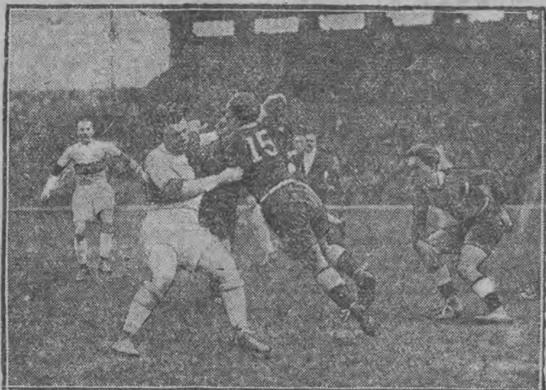
Drużyna „Maoris” w walce z „Paryżem”.

Jak już donosiliśmy, po Francji i Anglii podróżuje obecnie nowozelandzka drużyna rugbyistów „Maoris”. Na terenie Europy nie znajdują niemal przeciwników. Na 9 meczów z najlepszymi francuskimi drużynami zwyciężyli Maoris 8 razy, raz przegrali z reprezentacją Paryża, wykazując stosunek 240:42 punktów na swą korzyść.