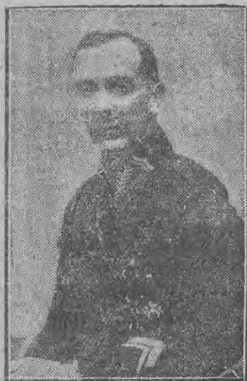
zmarły komisarz policji warszawskiej