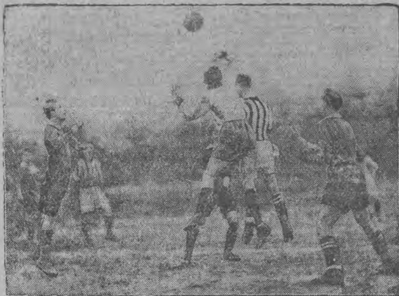
Bramkarz Legji, Bednarowicz, w opałach.