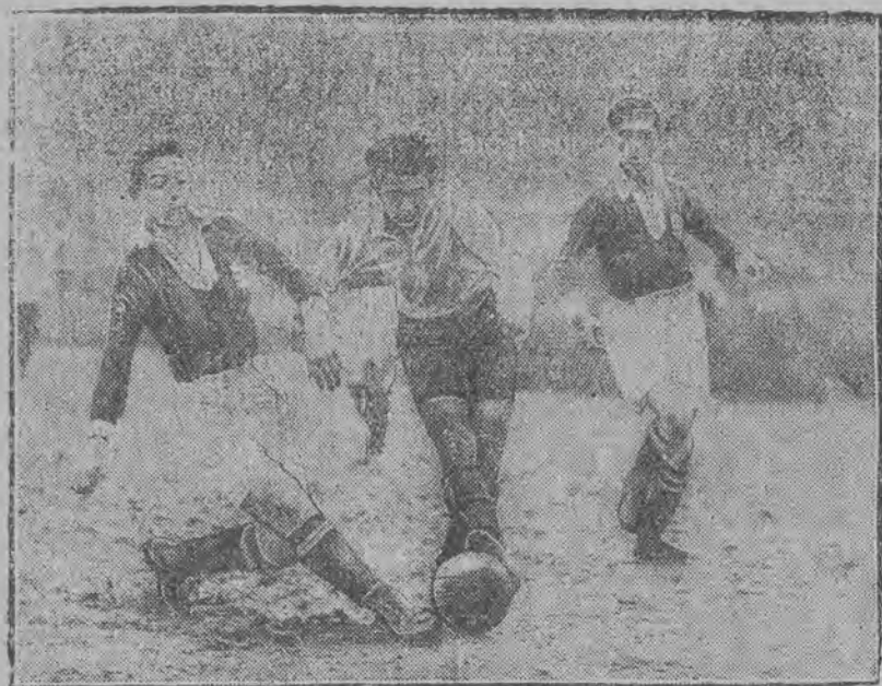
„Skra” w ataku.

ny. Nowicjusze w A klasie nie o-degrają prawdopodobnie poważ-niejszej roli w mistrzostwie, po-dobnie, jak Czarni. Na ostatnich bowiem rozgrywkach z Skrą nie wykazali klasy lub systemu, a