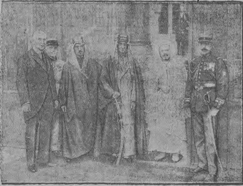
Następca tronu moabickiego na paryskim bruku.

W tych dnach przybył do Francji książę Fajsal, następca tronu emira moabitów, jedna z najciekawszych osobistości Wschodu. Na fotografii naszej widzimy go na schodach pałacu Elizejskiego w otoczeniu swoich dwóch szambelanów z członków domu prezydenta republiki francuskiej.