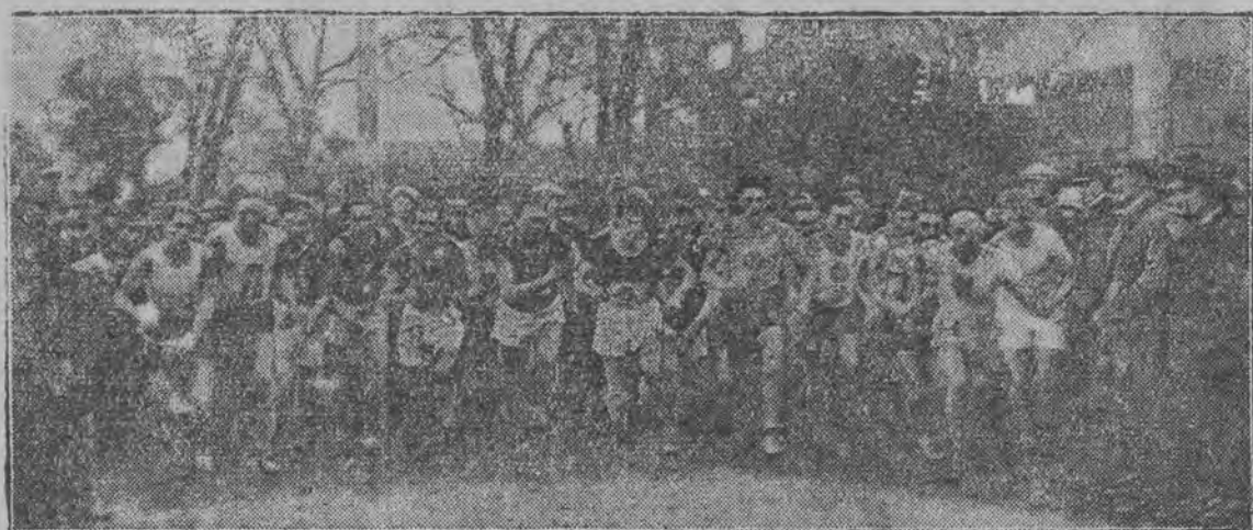
Zawodnicy ruszają ze startu.