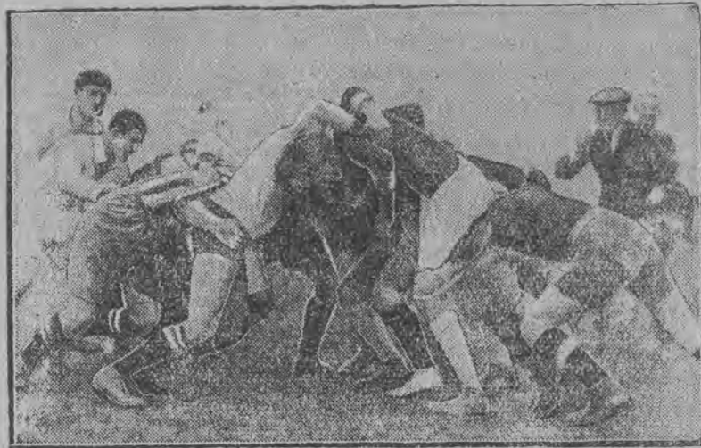
Moment t. zw. „zmagania się”. Piłkę wrzuconą między obie drużyny usiłują gracze wygarnąć nogami poza siebie.

Ilustracja nasza przedstawia S. a państw. inst. wych. fizycznej moment z meczu rugby (tak rzadkiego. Mecz ten odbył się na boiskach u nas) między drużyną A. Z. artylerji zenitowej.