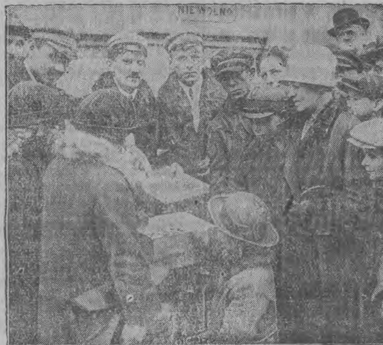
Wielka loteria fantowa w Warszawie.