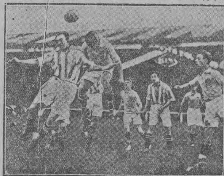
Groźna sytuacja pod bramką Paryża po rzucie z rogu

wysłał na mecz powyższy doskonały „garnitur“ — spodziewali się więc pewnej wygranej. Zawody odbyły się w Paryżu w stadionie Buffalo i przylądowało się im przeszło 25.000 widzów, z wielkim zainteresowaniem obserwujących prze-