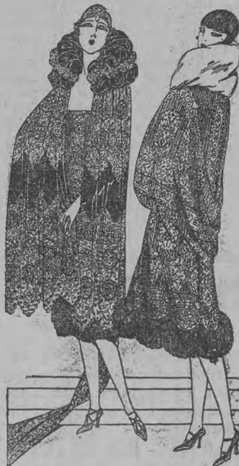
Płaszcz do teatru i na bal