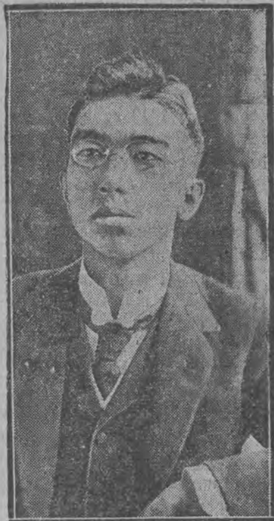
Następca tronu, książę Hiro - Hito.