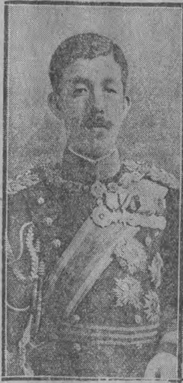
Cesarz japoński Joszi - Hito.

ko minister wojny; admirał Take-szi Takarabe — minister marynarki; baron Kijuro Szidehara — minister spraw zagranicznych; p. Ju-ko Hamaguzsi — minister spraw wewnętrznych; p. Rjahei Okada — minister oświaty, wicehrabia Kijosziro Inuże — minister kolei że-