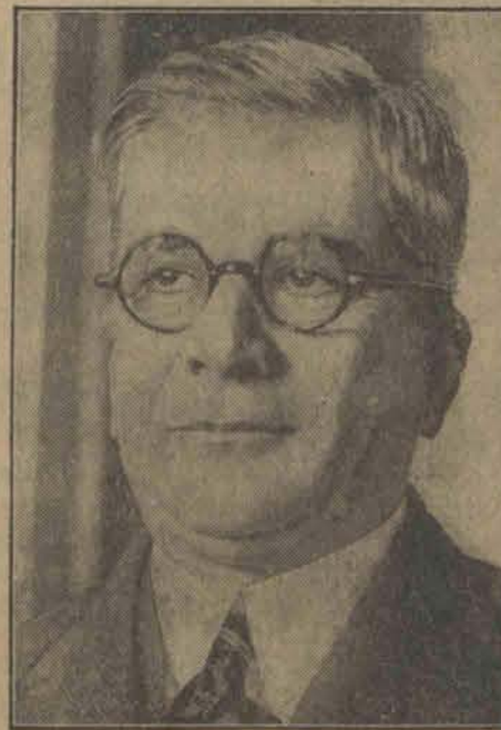
MACHADO, prezydent republiki Kuby — gdzie się obecnie odbywa kongres panamerykański.

Redakcja: Zawadzka 1. Administracja: Piotrkowska 11. Telefony: 38-26, 228 i 229. Redakcja otwarta dla interesantów tylko od godz. 11 rano do 2 po poł. Administracja czynna od godz. 9 rano do 7 wiecz. bez przerwy. Redaktor lub jego zastępca oraz dyrektor wydawnictwa przyjmują od godz. 1 do 2 po poł.