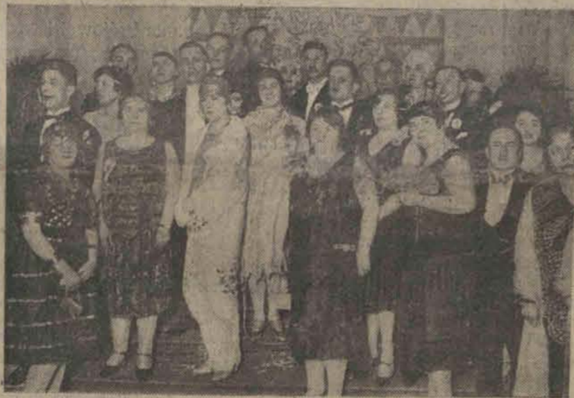
Jedną z najlepszych zabaw sezonu karnawałowego jest corocznie bal, którego dochód przeznaczony jest dla najniezwyklejszych, umieszczonych w Zakładzie w Kochanówce. Zabawa tegoroczna usprawniła w pełni piękną tradycję ubiegłych lat.