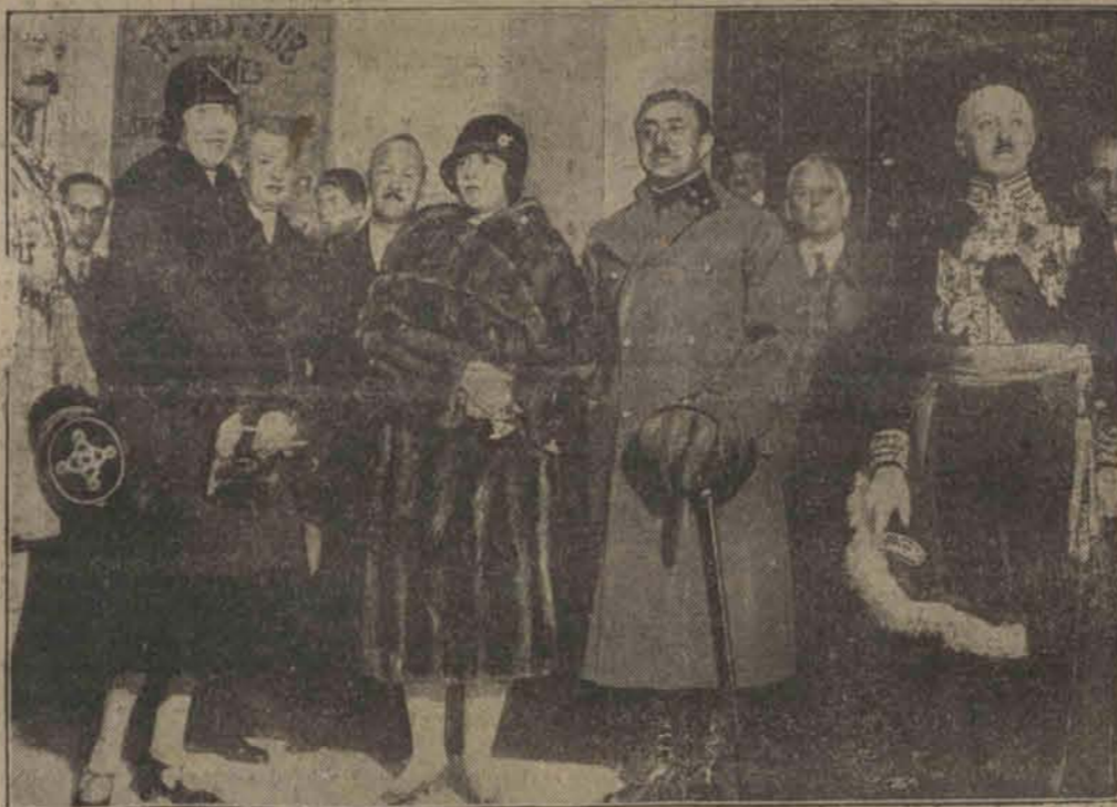
Król Amanullah wraz ze swoją małżonką po przybyciu do Paryża, skąd przez Berlin uda się do Warszawy.