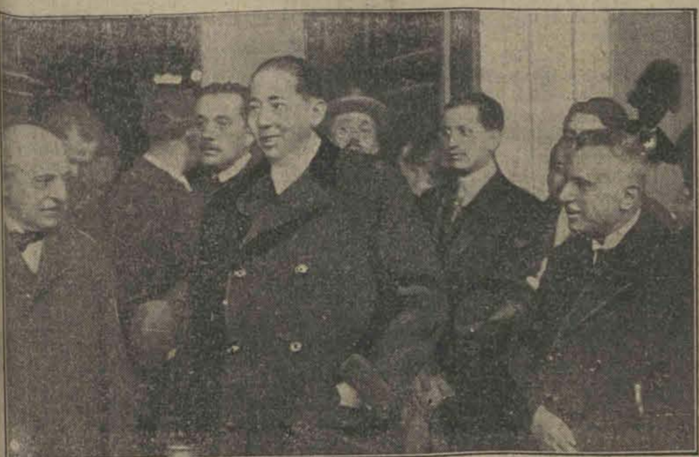
Rumuński minister Titulescu przybył do Rzymu, gdzie według doniesień prasy paryskiej, toczą się narady nad zawarciem włosko-rumuńskiego przymierza.