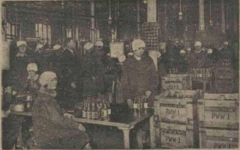
Sala rozlewni wódek.