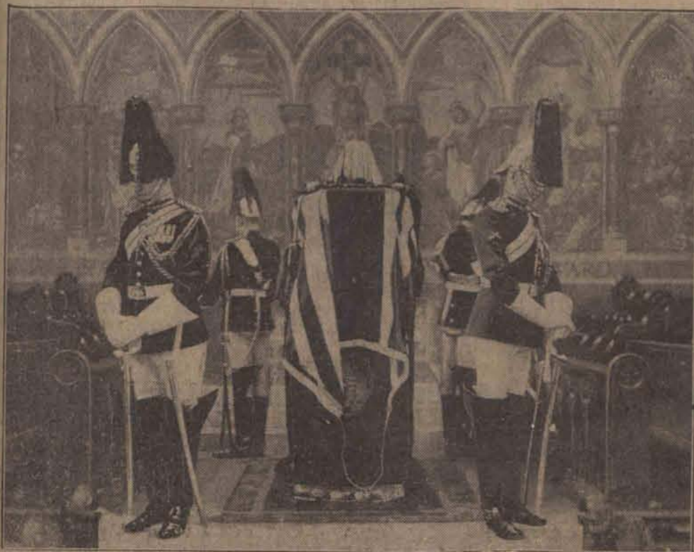
Trumna ze zwłokami marszałka Haiga, wodza wojsk angielskich w czasie wojny światowej w kościele A. Columba. Wartę honorową pełnią oficerowie gwardji królewskiej. Trumnę okryta flaga państwowa, na której leży buława marszałkowska. Wódz spada i helm wodza.