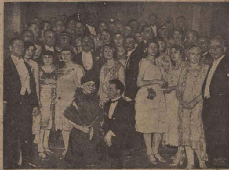
Cześć komitejtu i gości doskonale udanej zabawy.