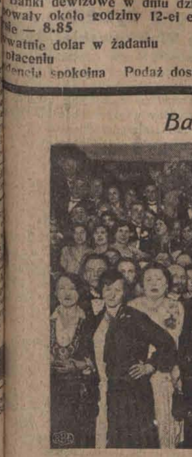
W sali Manteuffla odbyła która