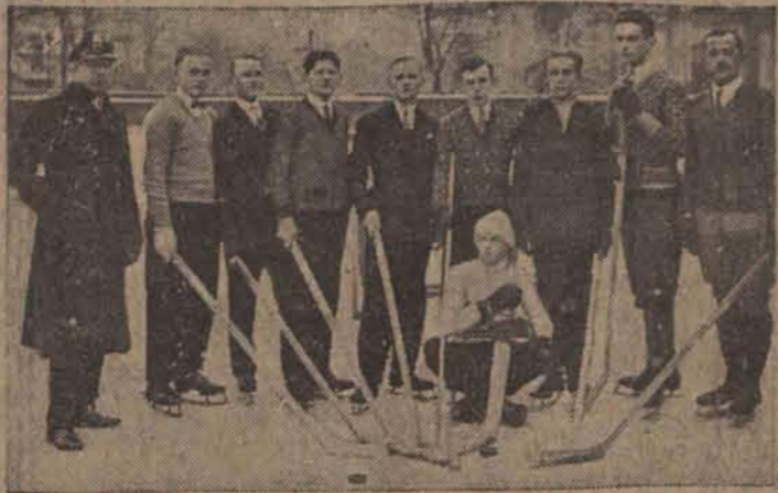
W trakcie tyżwiarskim przy ulicy Przejazd odbyły się pierwsze w naszym mieście zawody hokejowe między „S. S. Union”, a O. P. W.