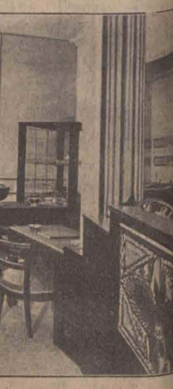
rdzewiejąca stal o srebrzysto-żółtej barwie w Paryżu.

Dyrektor ubezpieczeń społecznych uznał, iż majstrowie i podmajstrowie fabryczni winni być zaliczeni w poczet pracowników umysłowych, korzystających z emerytur i przyrzekł sprawę tę uregulować w mvsł życzeń delegacji.