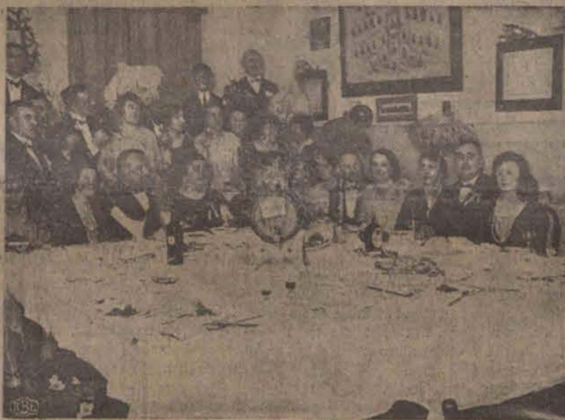
Komitet dorocznego balu Polskiego Związku Pracowników Kasy Chorych na wspólnym śniadaniu po pracy. Bal ten należy zaliczyć do rzędu najbardziej udanych.