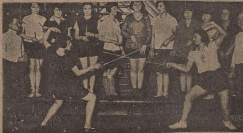
Wyczerpana floretem w osrodku wychowania fizycznego przy DOK w Łodzi.

owanie. dszkodował wojennych e w porcie w Rouen. h zapustów. ków. etego Walentego, konie sa iwe krowy rycza żałośnie. okazują niepokój i zdenerw o w dawnej Polsce dobry dosiadał konia w dzień świt o a myśliwi trzymali psy w dyż puszczone wolno gonili jak szalone, y wściekły lub wcale nie omów. Radio-kącik wa, 1111 m. — 12.00 Hejnał z 15.00 Komunikaty; 16.20 Pro y periodycznych omówi prof. H Odezyt p. t. „Boczna antena” Inawer; 17.45 Transmisja z Po spółudniowy. Udział biorą: Or p. a. c. pod batutą p. St. Ster na Wojciechowska (sopran); 19 liczy; 19.15 Rozmaitości; 19.2 Walka z chorobami wenerycz Szczodrowski; 19.55 Pogadank ytku Dzieje Muzyki, wygłosił p ki; 20.15 Transmisja koncertu rosyjskiej p. t. przy współudziale najwybitniejszych gwiazd ekranu son najpiękniejsza kobieta na świecie. ki wykona pieśń rosyjską. Ilu ysoka wartość artystyczna i nast soboty i niedziela o godz. 1 po Dr. TUPEL Szkolna 12. oroby, włosów rne, wenerycz i moczopłociwe zenie prom. Ro gna i lam pa kwarcona. zrymuje od 12— o poł. i od 6—9 wiecz. Dr. GUBICZ gelniana 43 tel. 41-32. — cialista chorób nych, wenerycz ych i moczopł owych. Lecze szt. słońcem yżymowem. yżymuje od godz. 8-10 i 5-8 n zamiejscowych, chociażby posiada a centrale gdzie indziej o 50 p scowych. zne o 100 procent drożej. druk ogłoszeń, komunikatów i odpowiada. słane bez oznaczenia honorarium ne. ówny użytych jak i odrzuconych wydawnictwo odpow. Władysław Ulatowski