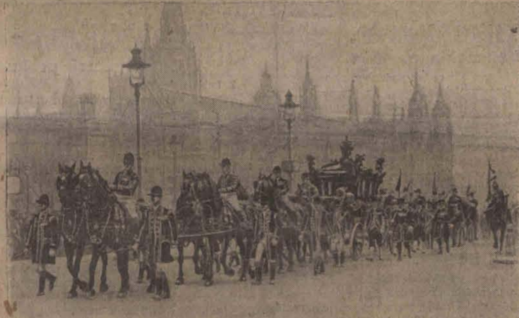
Tradycyjny przejazd karety z parą królewską z pałacu Buckingham do gmachu parlamentu.