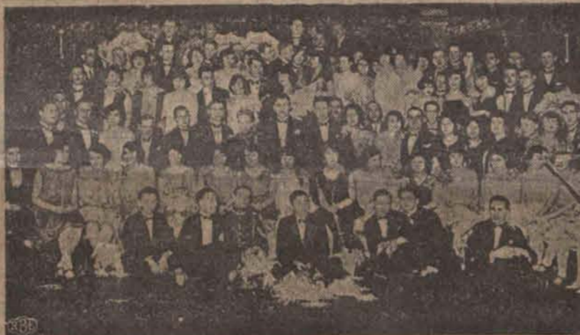
"Bal Czerwonych" urządzony przez Łódzki Klub Sportowy w sali Manteuffla, zgromadził liczne zastępy zwolenników i sympatycznych sportowców.