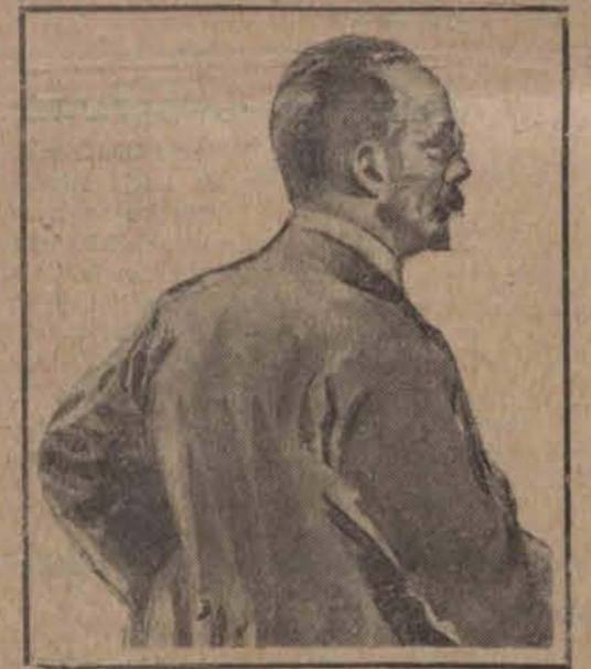
Profesor dr. J. Fibiger, znakomity badacz na polu zwalczania raka, zdobywca nagrody Nobla w dziedzinie medycyny zmarł po krótkiej chorobie w Kopenhadze.

Spółdzielnia Pracowników Państwowych „Król Dancingu” Początek przedstawień o g. 5.30, 7.15 i 9.30 wiecz.