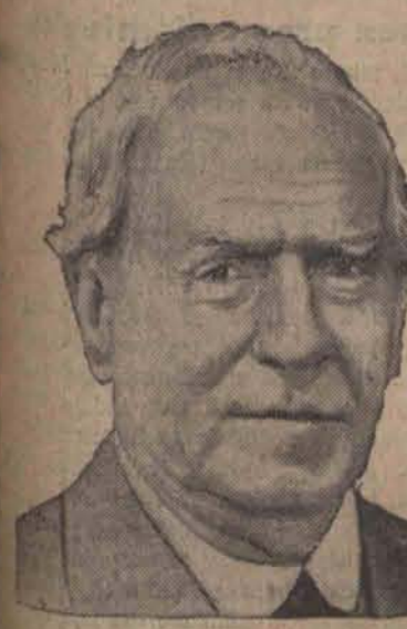
LORD ASQUITH OF OXFORD, premier Wielkiej Brytanii, wygłosił wczoraj rano...