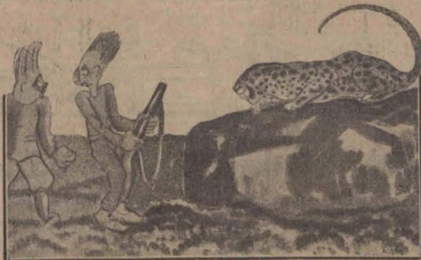
Myśliwy I: — No strzelajże temu zwierzęciu prosto w łeb. Myśliwy II: — Ttak, ja-ja-latwo ceci popopowiedzieć, kkkiedy mmimi ppałec z mrozu zzesztywniał.