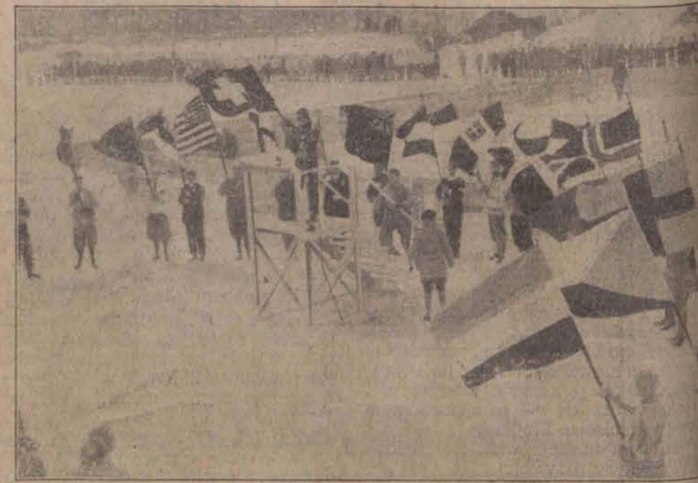
Szwajcarski oficer Eidebenz, stojąc na trybunie z flagą swego państwa w składzie w otoczeniu przedstawicieli wszystkich narodów olimpijską przysięgę.