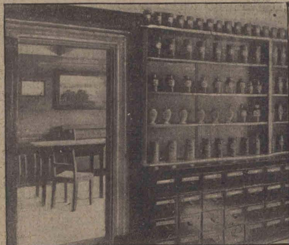
Apteka w Grimstad w której Ibsen wykonywał swój pierwotny zawód. W tyle pokoi, służący mu za mieszkanie, w którym powstały jego pierwsze utwory.