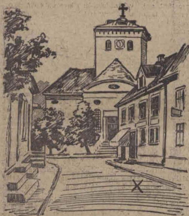
Dom, w którym znakomity pisarz ujrzał światło dzienne.