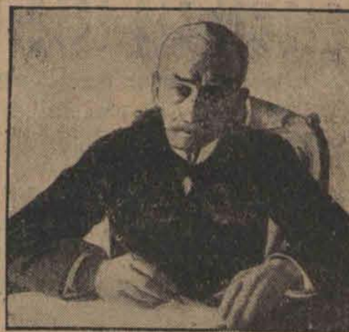
General CARMONA portugalski dyktator, został obrany po- nownie prezydentem państwa.