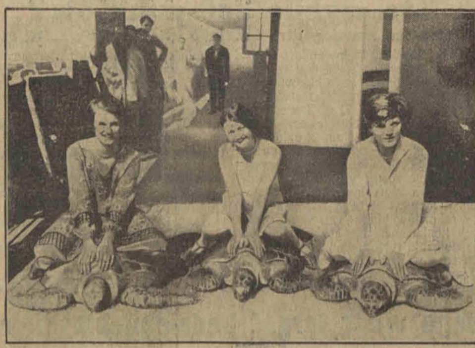
Trzy młode amerykanki urządziły na pokładzie „Empress of Australia” oryginalne wścigi na żółwiach.