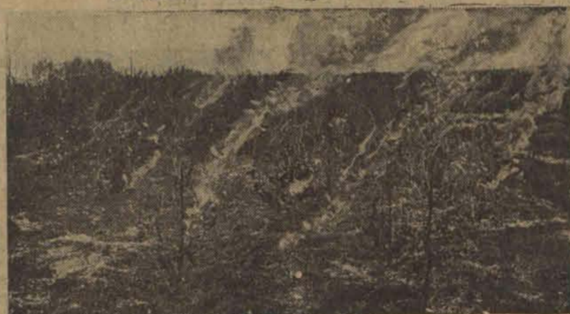
Wczoraj donieśliśmy o groźnym pożarze, który objął kilkanaście morgów lasu zgierskiego i z trudem został opanowany po całonocnej akcji okolicznych straż pożarnych i mieszkańców. Na zdjęciu widzimy tlejące resztki lasu.

Krwawe zajście pod Kołem patrz str. 2-ga