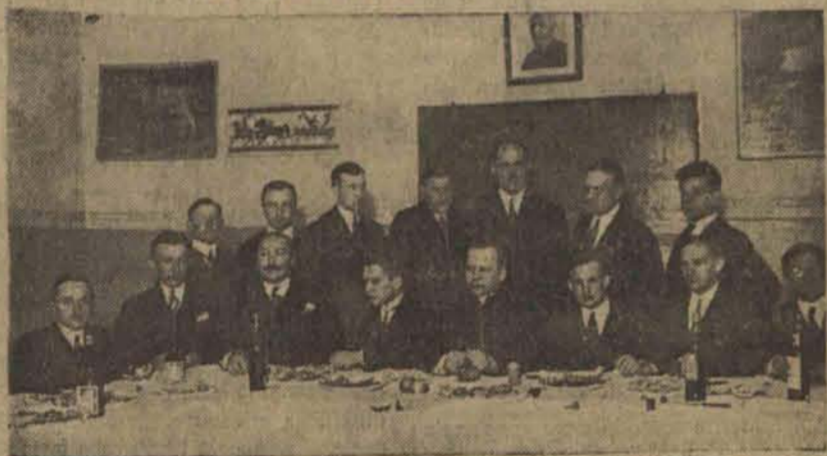
Tradycyjne „Jajko” Koła Byłych Wychowanków Gimnazjum A. Zimowskiego w Łodzi w gmachu gimnazjum przy ul. Bocznej 5.