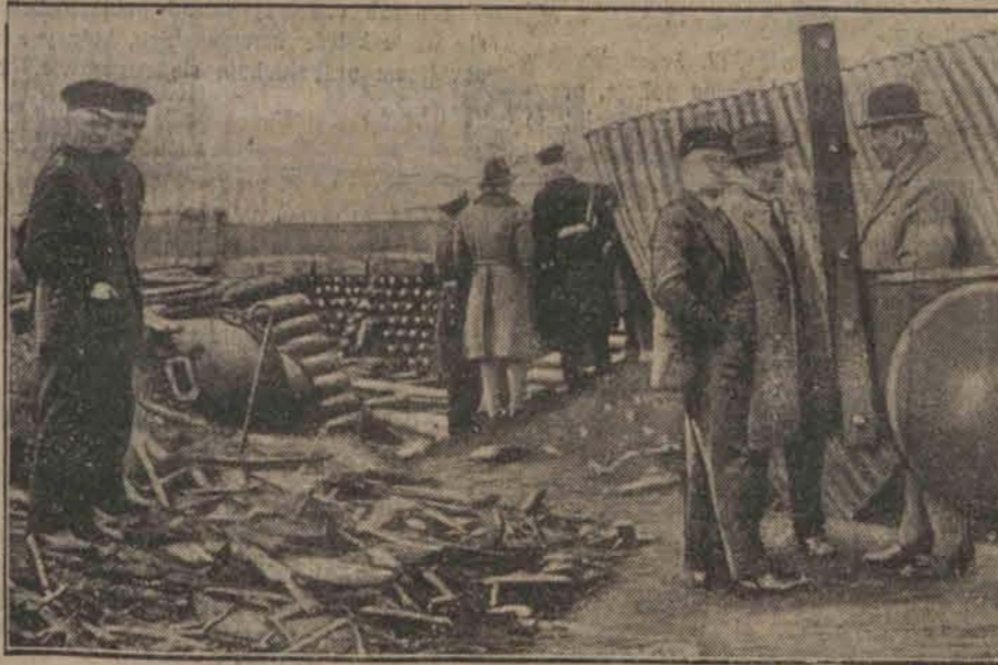
Miejsce eksplozji tanku z trującym gazem na wyspce Peute pod Hamburgiem, badane przez komisję rzeczoznawców.