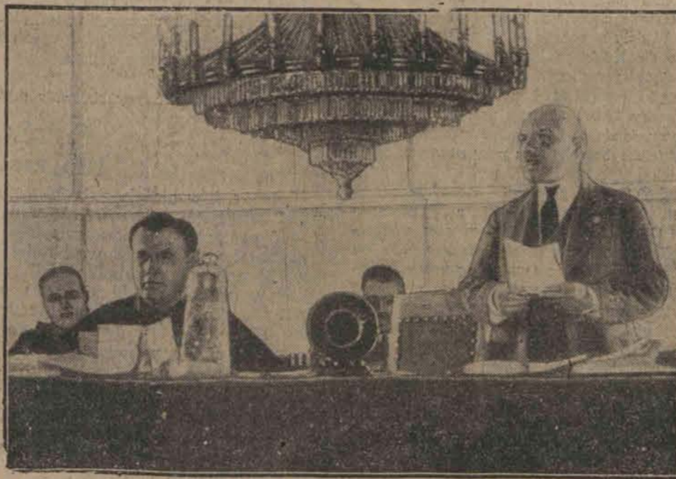
Prokurator Krylenko odczytuje akt oskarżenia. Polityczne i propagandystyczne znaczenie procesu podkreśla mikrofon radiostacji moskiewskiej, ustawiony na stole przed prokuratorem.