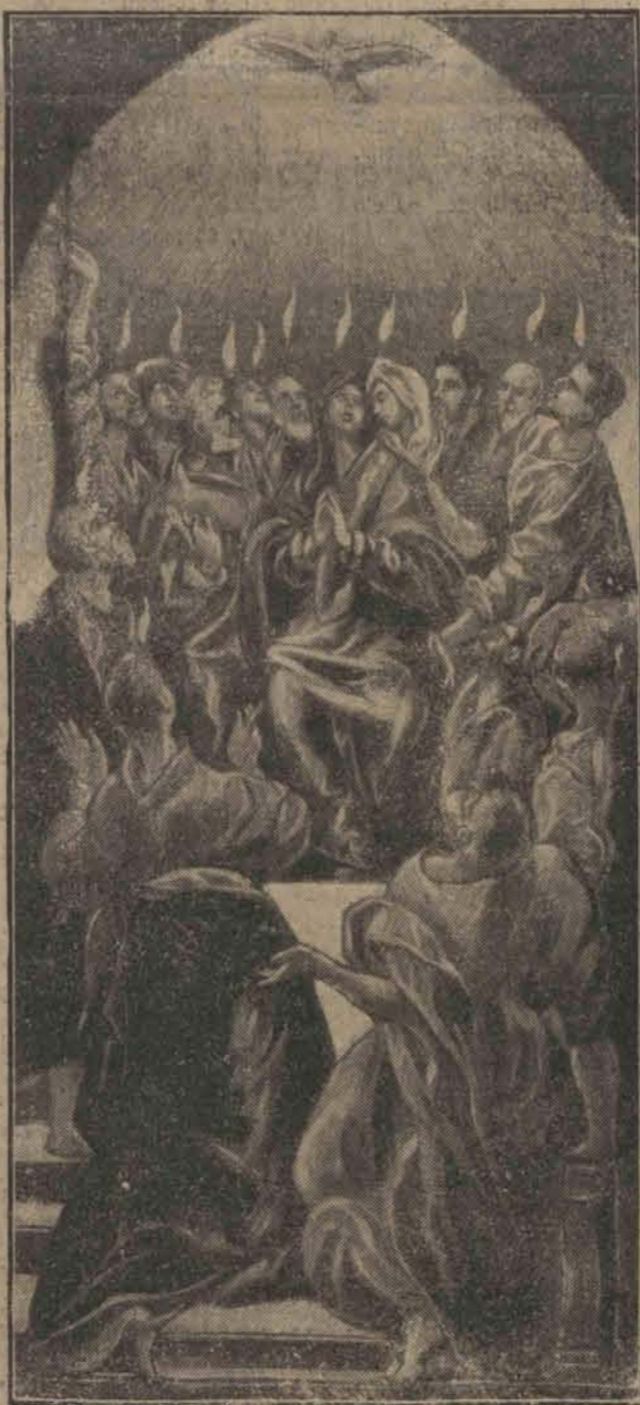
Zesłanie Ducha Świętego — znakomite arcydzieło słynnego malarza El Greco w muzeum Prado w Madrycie.