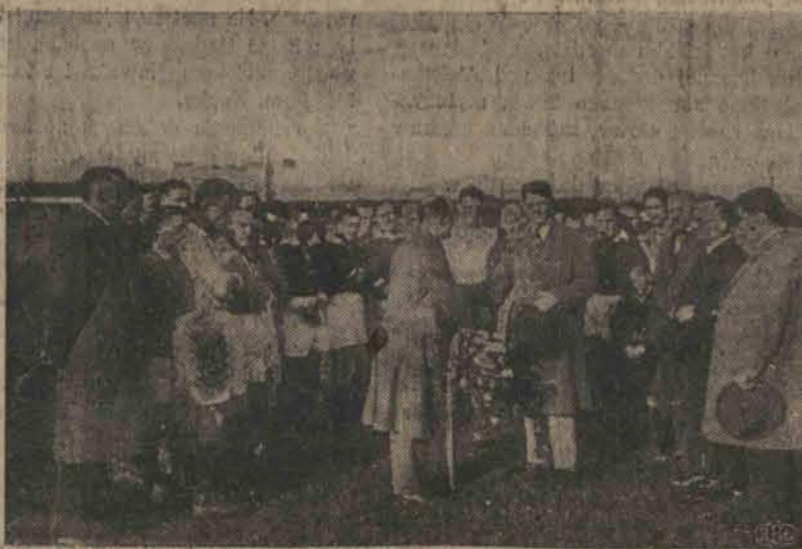
Prezes Ł. K. S-u p. Konopka wręcza kwiaty prezesowi klubu „Hertha”, który w czasie Zielonych Świątek gościł w Łodzi.