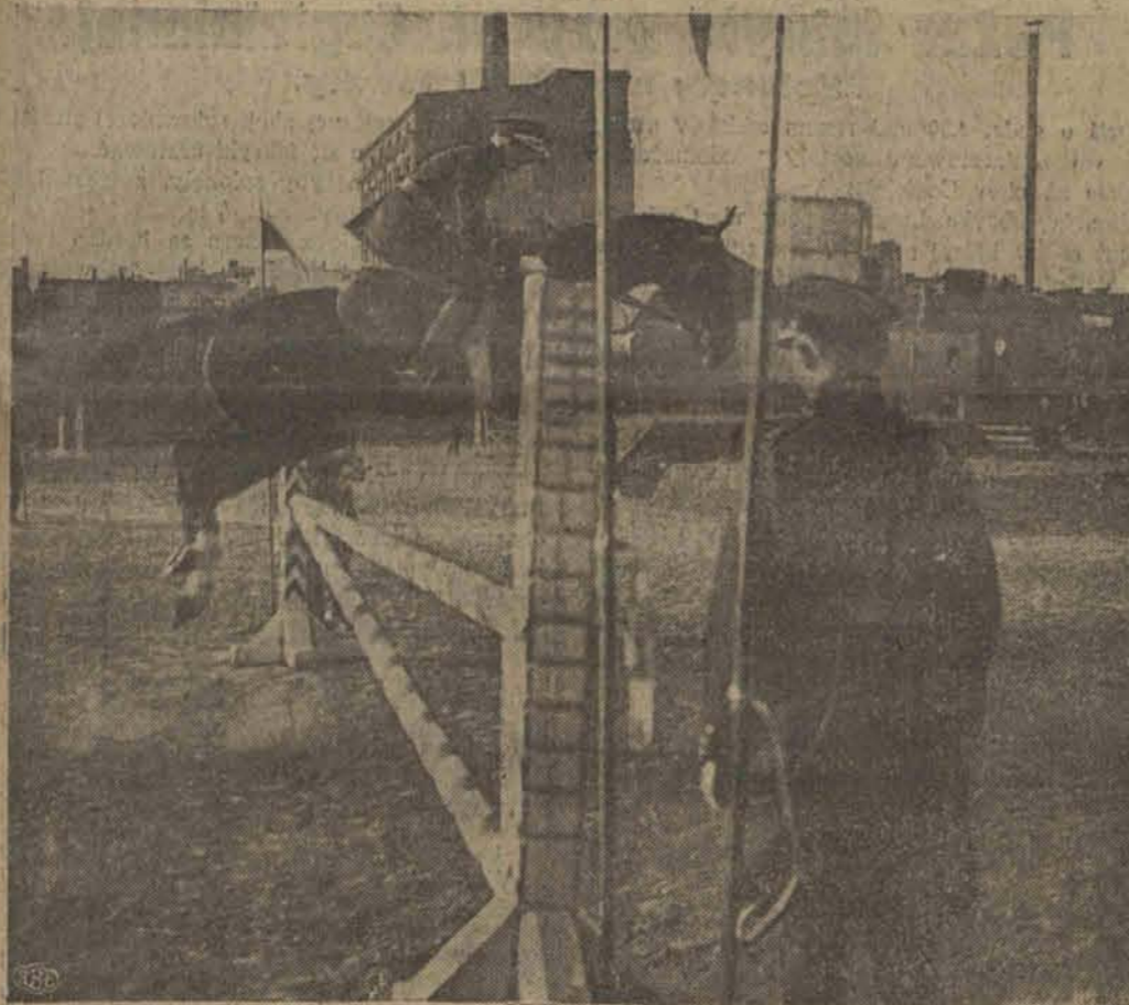
P. Tarwit, komendant konnej policji w czasie skoku przez przeszkodę.