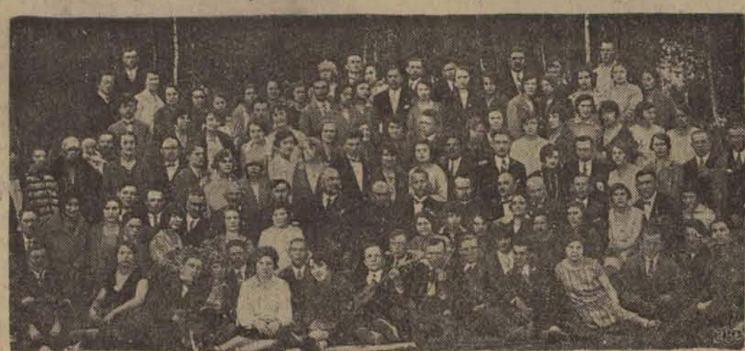
Kościelne chóry (kościół św. Krzyża, św. Antoniego i Serca Jezusowego) na wycieczce w Strykowie.