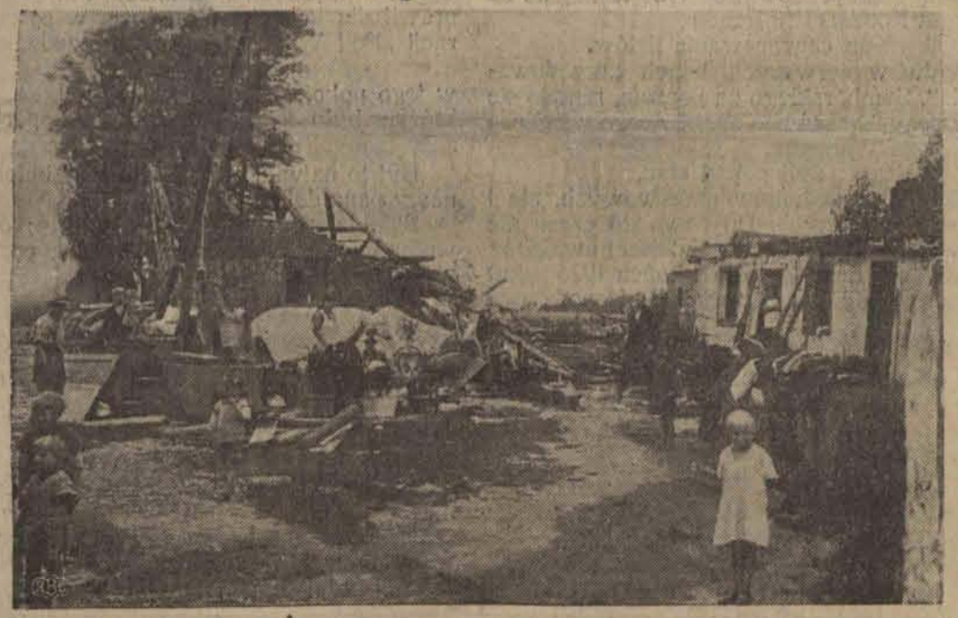
Pogorzelnicy z ulicy Konstantynowskiej nr. 167 z resztkami uratowanego dobytku.