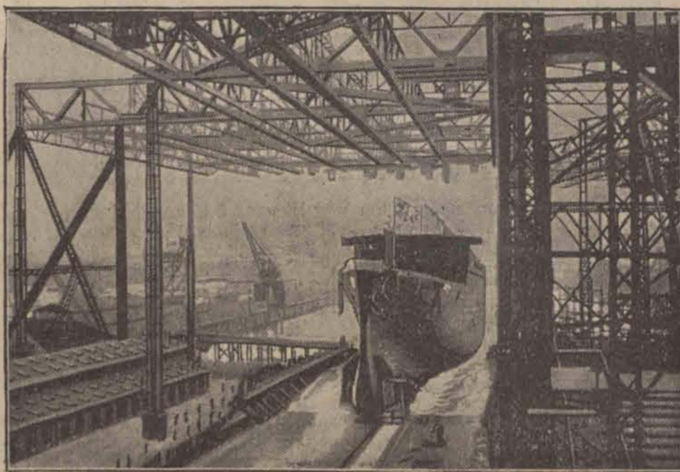
Krażownik niemiecki „Europa” w chwilę opuszczania doków.