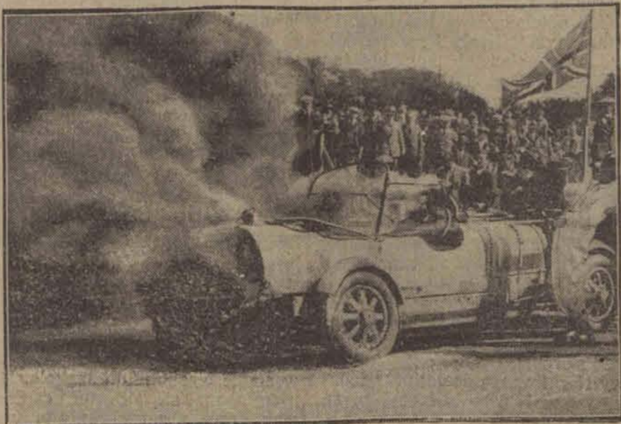
Podczas wyścigów samochodowych zorganizowanych przez królewski klub automobilowy w Belfaście (Irlandia) spłonął doszczętnie samochód mistrza świata i faworyta tłumów kapitana Malcolm Campbell'a. Nieprzytomnego kierowcę wydobyli z płonącego auta tłumy, które pospieszyły na ratunek.