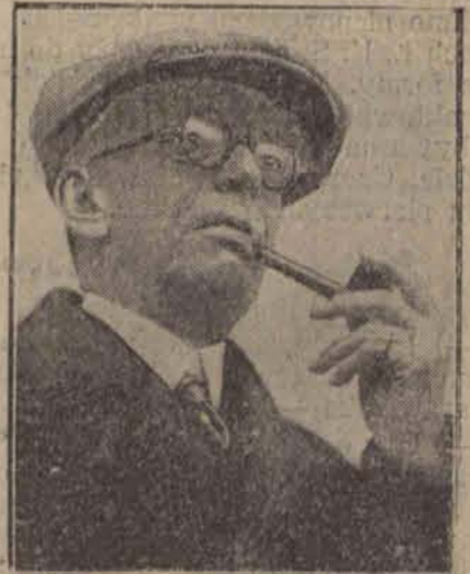
GEORGE HARVEY były poseł Stanów Zjednoczonych zmarł w 64-ym roku życia.

Nowo obowiązująca „Ustawa Automobilowa” do nabycia w księgarni „CZYTAJ”, Łódź, Narutowicza 3. Cena za egz. — Z 11.