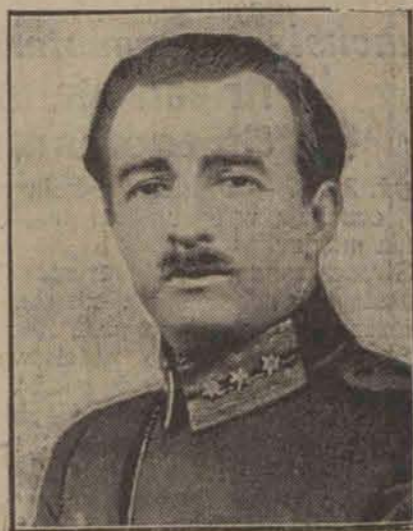
Ahmed-Zogu ma być obwołany królem Albanii.

Redakcja: Zawadzka 1. Administracja: Piotrkowska 11. Telefony: 38-28, 228 i 229. Redakcja otwarta dla interesantów tylko od godz. 11 rano do 2 po poł. Administracja czynna od godz. 9 rano do 7 wiecz. bez przerwy. Redaktor lub jego zastępca oraz dyrektor wydawnictwa przyjmują od godz. 1 do 2 po poł.