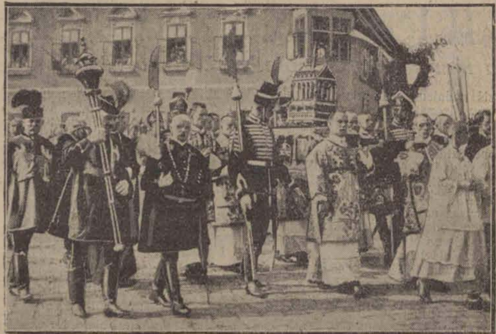
20-go sierpnia każdego roku t. j. w dzień św. Stefana Budapeszt stroi się w odświętne szaty. Dzień ten jest wielką uroczystością narodową Węgier. Na zdjęciu procesja, obnosząca po ulicach miasta złoty relikwiarz gdzie na purpurowej poduszce spoczywa ręka króla Stefana I, który pierwszy ochrzcił Węgry.