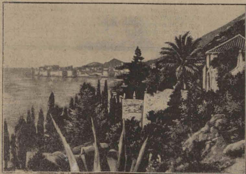
Jeden z najpiękniejszych zakątków Jugosławii położony nad morzem Adriatyckim w pobliżu Raguzy.