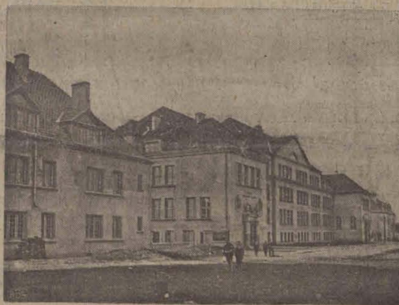
Nowowbudowany gmach szkoły powszechnej i domy dla nauczycieli przy ulicy Podmiejskiej na Nowem Rokicciu.