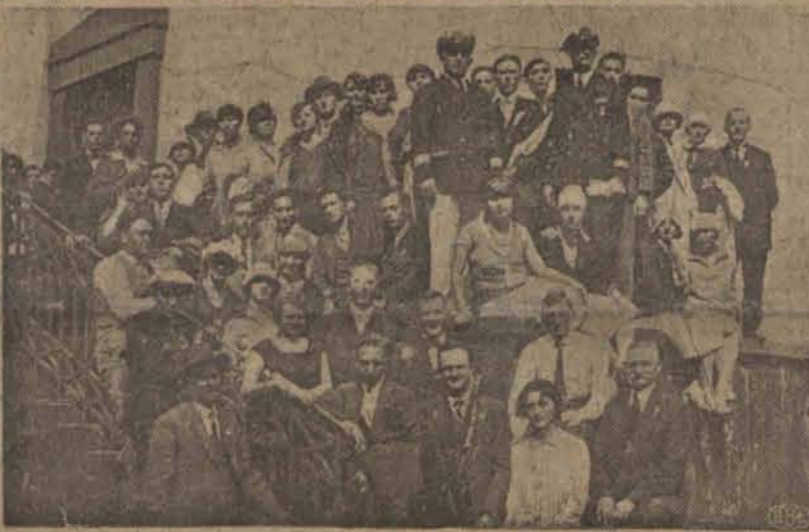
Dużem powodzeniem cieszą się wycieczki organizowane przez oddział łódzki Ligi Morskiej i Rzecznej. Na zdjęciu grupa łodzian na schodach kasyna w Gdyni.