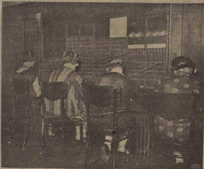
Telefonistki podczas pracy w centrali, która w przyszłym roku ustąpi miejsca nowoczesnej stacji automatycznej.