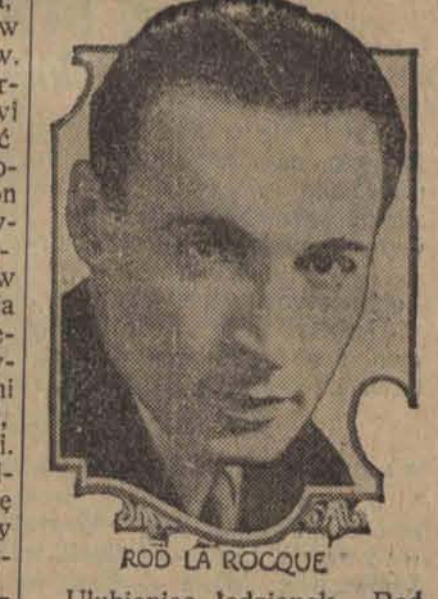
Ulubieniec łodziaków. Rod La Rocque ukaże się w sezonie zimowym jako „Bandyta” i „Student” oraz w filmie „Przygody Brygadiera Gerarda”