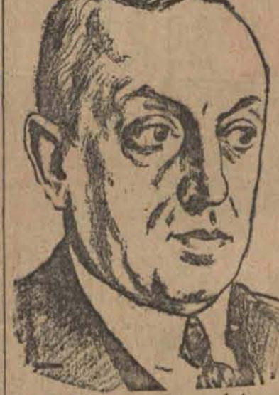
Dr. F. Thyssen, przewodniczący reńskiego kartelu stalowego pozabawił 250000 robotników pracy